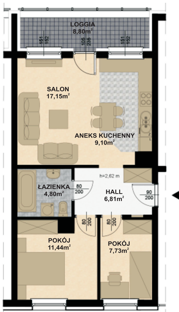
RZUT V PIĘTRA skala 1:100