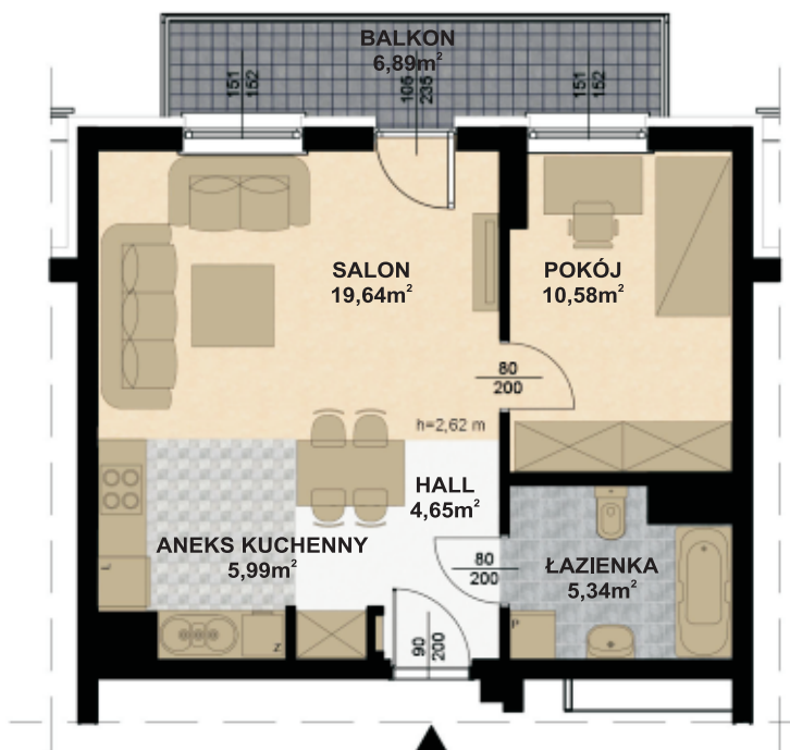
RZUT II PIĘTRA skala 1:100