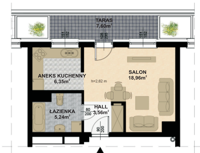
RZUT VI PIĘTRA skala 1:100