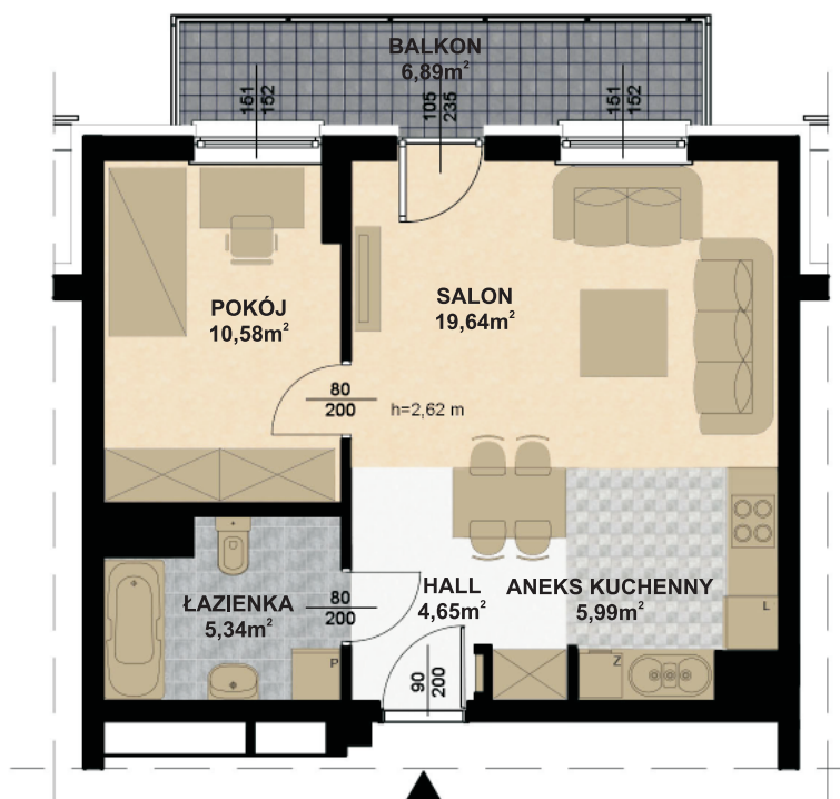
RZUT IV PIĘTRA skala 1:100