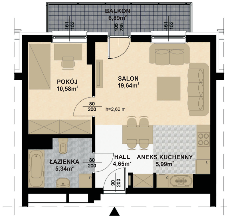
RZUT II PIĘTRA skala 1:100